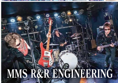
MMS R&R ENGINEERING

音響設備もより本格的になったメインステージでは、3日(金)と4日(土)の2日間に盛大なるライブパフォーマンスを予定。