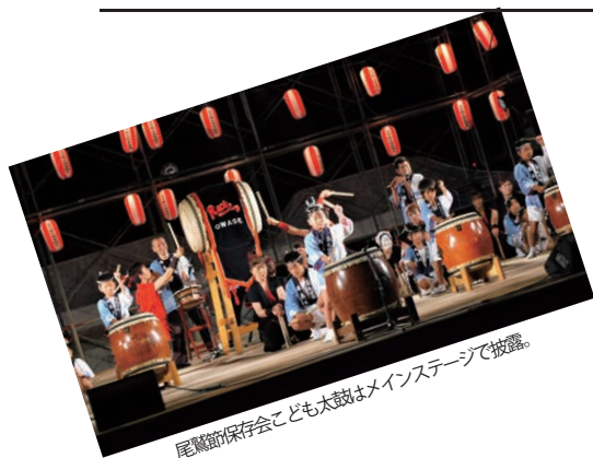
尾鷲節保存会こども太鼓はメインステージで披露。