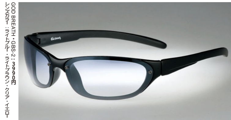
GOD BREATH・GBS-2：3990円 レンズカラー：ブラック・ブルー・グリーン・レッド