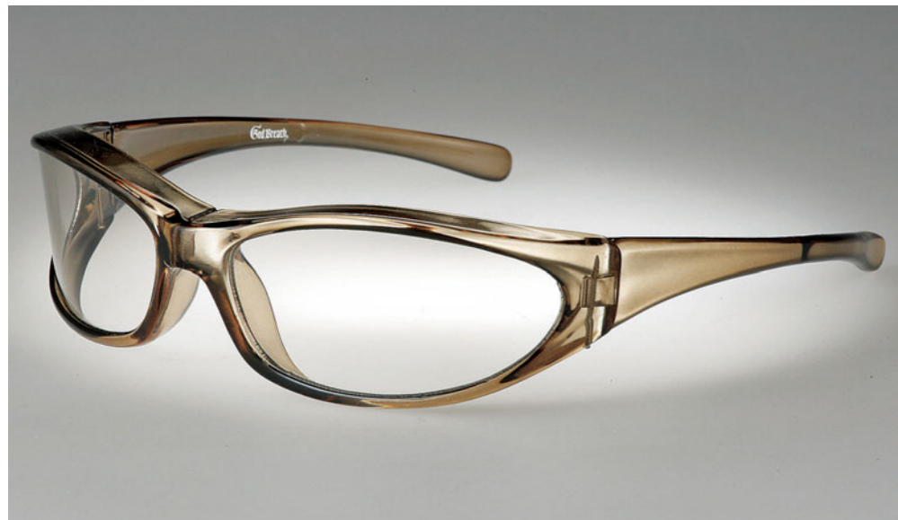
GOD BREATH・GBS-7：3990円 レンズカラー：ライトブルー・ブラウン・ライトスモーク・クリア

オリジナルフレームのカーブと大きめのレンズ&ガードにより嫌な風の巻き込みを防ぐことができる。