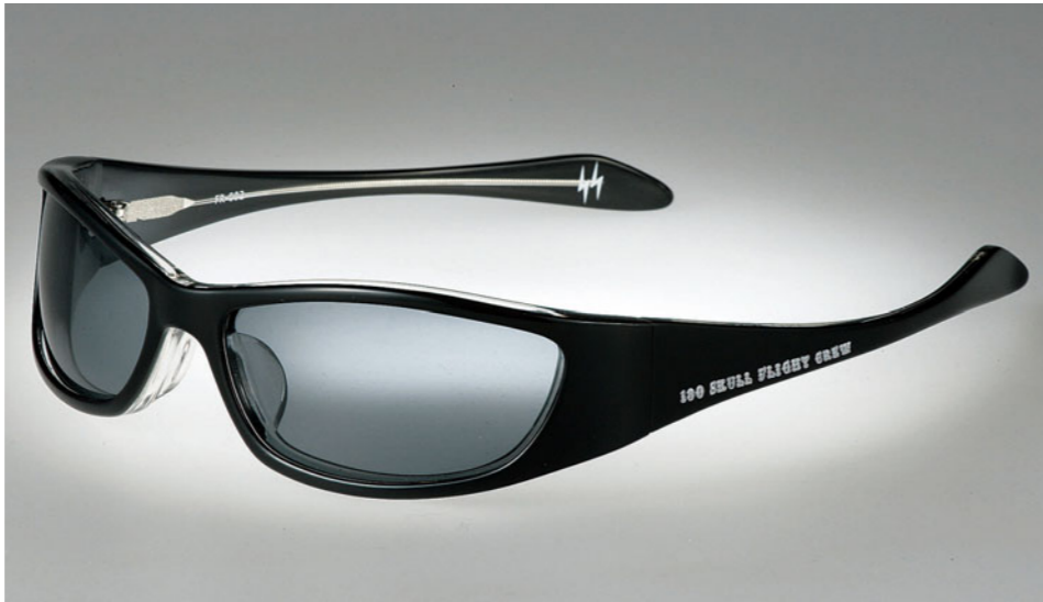
SKULL FLIGHT 180 SHADE・偏光レンズ：1万290円 / ノーマル：9240円 / 偏光レンズ+ボードン加工仕様：1万1340円

アームにはオリジナル商品の証でもある商品のネームを印刷。モノ作りへの情熱はすさまじい。