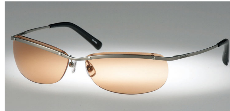
シェードCS-05：2万800円 カラー：オレンジ