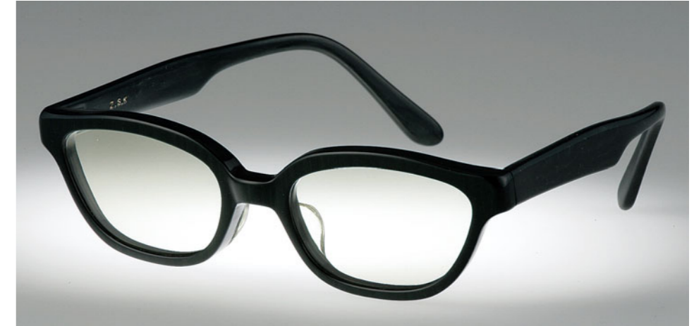
オリジナル眼鏡フレーム(サービスレンズ各色付)：4万425円 プレーン。カラー組み合わせはオーダー時に相談。度つきレンズにも対応。