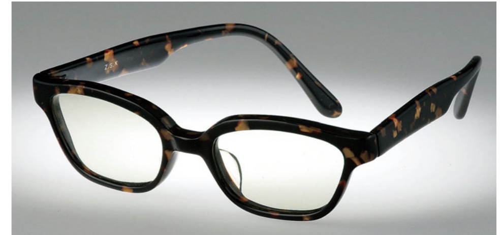
オリジナル眼鏡フレーム(レンズなし) ケース付：3万7275円 ベツ甲調。カラーや仕上げ(ツヤの有無)などが選べる。要問合せ。

ベツ甲調のマーブル。多彩なカラーが用意されているので他にはないものが作れる。職人の手によって作られるハンドメイドの刻印は伊達ではない。