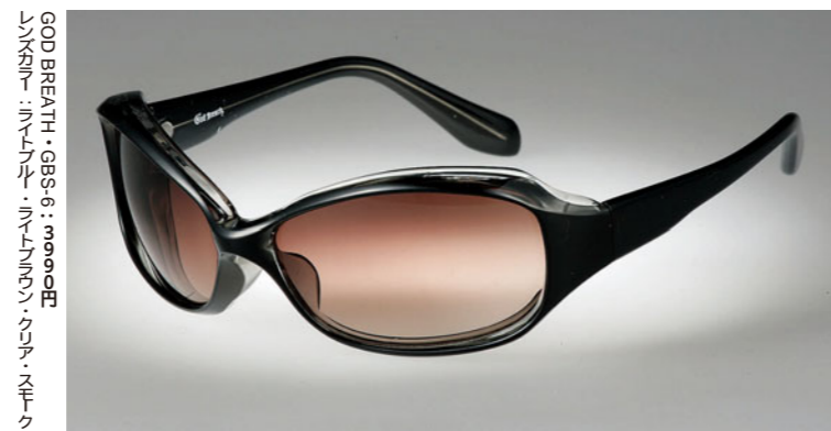
GOD BREATH・GBS-6：3990円 レンズカラー：ブラック・ブルー・グリーン・スモーク