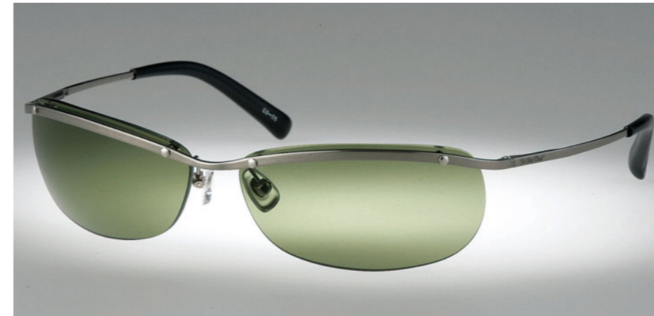
シェードCS-05：2万800円 カラー：ダークグリーン

他の素材と比べアレルギー性の低い純チタンとシリコンパーツを使用した軽くて強いフレームを採用し、つなぎ目のパネ丁番で長時間装着しても違和感のないフィット感を演出する。レンズには「NXT」を使用。「NXT」とは、人体を保護するライフセイビング・テクノロジーにおける米国大手企業により開発されたもので、透明度が非常に高く衝撃に強い性質を持っている素材。現在では飛行機のcockpit、米軍のアパッチヘリコプターのフロントガラスにも採用されている。もちろんそんな高性能のレンズならバイクで走っている時に飛んでくる小石や虫で傷がつく心配も皆無。スタイル的にも試行錯誤を繰り返し、風の巻き込みを防止する最良のデザインで、もちろんバイクから降りてもスタイリッシュに装着できる。