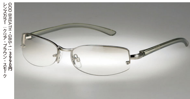
GOD BREATH・GBS-1：3990円 レンズカラー：クリア・ブラック・ブルー