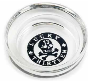
【LUCKY13/Death Skull Ash Tray】 ガラス製の灰皿。アクセサリー入れとしても使えるので、スモーカーにもونسモーカーにもオススメ。ギフトにも最適/1575円 (LUCKY13日本代理店エバークロー貿易 ☎04-2945-9175 www.rakuten.co.jp/lucky13)