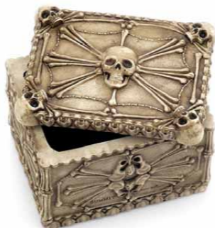
【スカルマルチケース】 乱雑になりがちなアクセサリーや、大切な小物を収納するマルチケース。蓋にマグネットが埋め込まれているので簡単にズレない。素材：ポリレジン/1890円 (SKULL DADDY (ネット販売のみ) http://skulldaddy.jp)