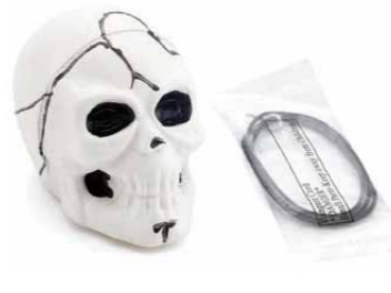
【スカルボーンのアテナトッパー】ありそうでなかったスカルの型のアテナトッパー。ワルの象徴“スカル”的ムードを演出したい時には最高に効果的/380円 (Candy Tower ☎06-6698-6969 www.candytower.com)