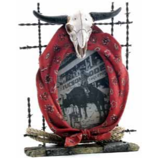
【ロングホーンズカルのピックアップフレーム】 超ワイルドなフォトフレーム。本体はレジン製で見事なほどリアルに仕上がっている。サイズ(約)：H27×W21×D7センチ/3200円 (Candy Tower ☎06-6698-6969 www.candytower.com)