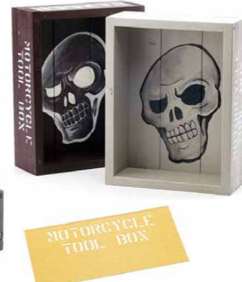
【スカルワンツールボックス】A4が大きいサイズのオリジナルウッドボックス。好きな色やデザインをカスタムしてくれる。他カラー：デザインあり/4000円 (アメリカ雑貨直営店CUNBERIDGE ☎019-607-4000 http://sun7.jp)