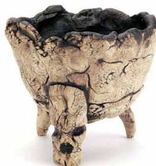
【大友窯SKULL/髷小物入れ】 脚の部分がさりげなく髷のモチーフになっている。灰皿や花器、カップなど用途はアイデア次第。ひとつひとつ手作業で成型した一点物。高さ8センチ。陶器製/5000円 (大友窯工房 ☎096-380-6449 http://otomogama.net)