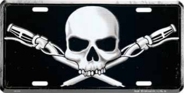
【スカルヘッドのライセンスプレート (クロスボーンハンドル)】 クロスボーンがバイクのハンドルになっているという。アメリカらしいアイデアの男らしいライセンスプレート/980円 (Candy Tower ☎06-6698-6969 www.candytower.com)