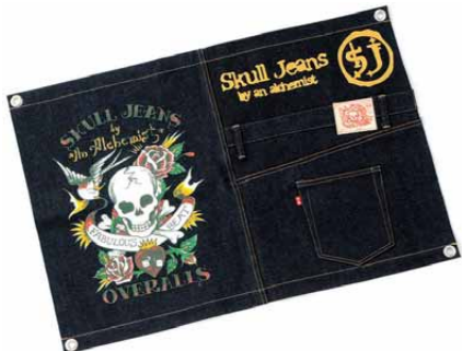
【Skull Jeans by an alchemist/デニム製バナー】 フラッシュ部分はラバープリント、ロゴはチェーンステッチ、ポケットには隠しレットなど、ジーンズのディテールをそのまま再現/9240円 (ファブフォー中目黒本店 ☎03-3791-7757 www.fabfour.co.jp)