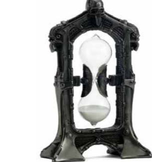
【メタリックスカルアワーグラス】 サンドタイマー(砂時計)独特のゆったりとした時間を演出してくれる。サイズ：H21×W13×D6センチ 素材：ポリレジン/3675円 (SKULL DADDY (ネット販売のみ) http://skulldaddy.jp)