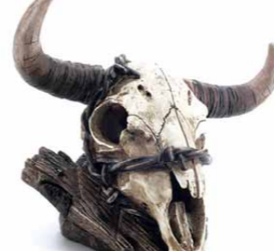
【バッファローズカルのナイトライト】 バッファローボーンをリアルに再現したレジン製のナイトライト。有刺鉄線が巻きついている美しいデザイン。サイズ：H20×W24×D16センチ/4900円 (Candy Tower ☎06-6698-6969 www.candytower.com)