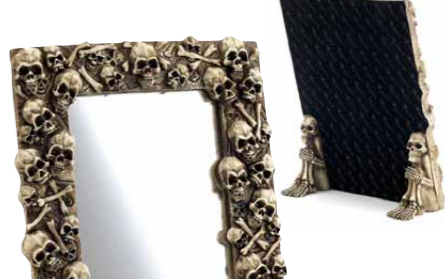
【スカルフレームミラー】 扉田(海賊)でもこだわりたい方にオススメ。スクリーンはスクリーンに合わせた色合い。また、小さなスクリーンも販売中。by:1990art (SKULL DADDY (ネット販売のみ) http://skulldaddy.jp)