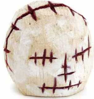
【骨飾/gettyカードスタンド】 スカルとしては半人前、若干“肉”が残ってる感じのgetty君は、角材から生まれたちょっと軽めのカードスタンド。ハンドメイド/735円 (四月館十黒 ☎086-425-9121 www.darkapril.net)