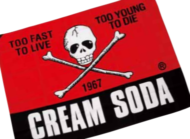
【CREAM SODA/角ドロフラッグ】 W約120センチ×H約90センチのオリジナルフラッグ/1575円 (PINK DRAGON ☎03-3498-2577 www.pinkdragon.co.jp)