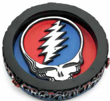
【Greatful Dead/Collectible Incense Burner】 中心の穴にインセンス(お香)を立てて使用。灰皿としても使える。裏側に穴が空いており、壁にもかけられるようになっている。直径4センチ/3780円 (TRIAD ☎045-431-9618 http://triadnet.hp.infoseek.co.jp)