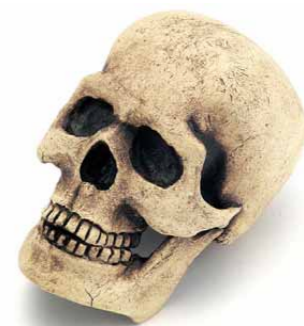
【大友窯SKULL/髷オブジェ】 陶土ならではの手触り&色合いと、本物の髷が持つ質感を融合。土遊び焼き上げまでこだわり抜いた、真正正銘世界でひとつだけの逸品/6000円 (大友窯工房 ☎096-380-6449 http://otomogama.net)