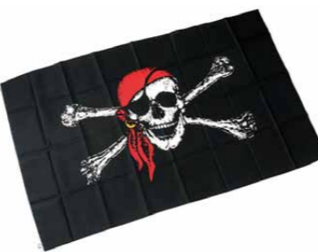
【海賊マークのジャンボタペストリー】 海賊と言えばこの旗印! わかりやすい海賊マークを大きくプリントしたタペストリー。サイズ(約)：H90×W155センチ/1800円 (Candy Tower ☎06-6698-6969 www.candytower.com)