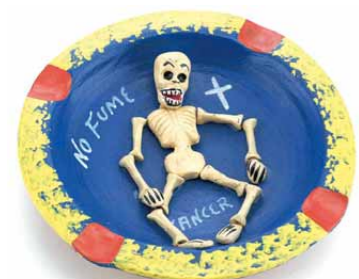
【MEXICO SKULL/メキシコ灰皿】 スペイン語で「タバコを吸うとガンになるよ」と書かれている。ユーモアのあるブラックジョークのいた灰皿。陶器製/1890円 (リビングストーン 那須店 ☎0287-63-8025 www.livingstones.jp)