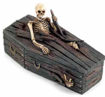
【スカル コフィンケース】 彩色、細部の作りなど申し分ない仕上がりレジン製小物入れ。特に棺の外壁の張り出しがかなりリアル! サイズ(約)：H8.5×W14×D7センチ/1570円 (大人の趣味空間 ☎048-687-3840 www.eorona.jp)