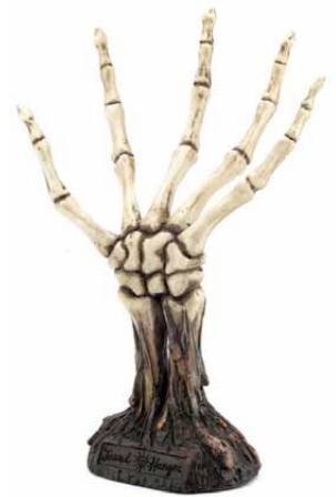
【スカルジュエリーハンガー】(一) 個個異なるリングをそのまま懸らせておける。SHOOP風アレンジメントインテリア演出。by:1990art (SKULL DADDY (ネット販売のみ) http://skulldaddy.jp)