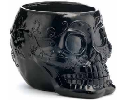
【CRIME/シュガースカルのプランター (黒)】 メキシカンスカルのプランター。植木を入れたり、小物入れにしたり、いろいろ利用できる。素材：FRP サイズ：H30×W28センチ/1万2600円 (Road ☎052-263-0050 www.road2009.com)