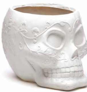
【シュガースカルのプランター (白)】 FRP製プランターの白バージョン。各色“ツヤあり・ツヤなし”と全部で4種類ある。サイズ：H30×W28センチ/1万2600円 (CRIMIE ☎03-5775-5505 www.crimie.com)