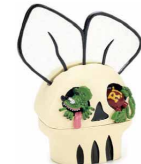
【RAT FINK Skull Flyジュエリーボックス】 レジン製のスカルフライジュエリーボックス。置物や小物入れにも最適。H13.3×W10.8×D5.2センチ/2940円 (MOONEYES ☎045-623-5999 www.mooneyes.co.jp)