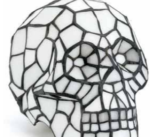
【Staind glass Skull light】 一点ずつ職人の手作りによるオリジナルのステンドグラス製スカラライト。光が床に反射し、簡単に部屋の雰囲気を出してくれる。ON/OFFスイッチ付/各1万8900円 (new territory ☎03-5784-2147 www.newterritory.net)