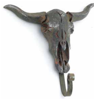
【カウスケルのウォールフック】 鉄の塊で作られたような見た目だが、実はレジン製。錆びた感じなど塗装でリアルに再現。サイズ(約)：H14×W16×D4センチ/1000円 (Candy Tower ☎06-6698-6969 www.candytower.com)