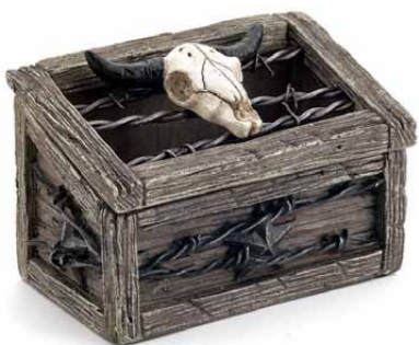
【スカル&ワイヤーのトリネットボックス】 ウエスタンデザインの世界観の小物入れ。朽ちた木の表情などをレジンでリアルに再現。サイズ(約)：H 8×W12.5×D7.5センチ/1800円 (Candy Tower ☎06-6698-6969 www.candytower.com)