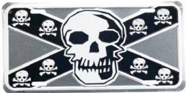
【スカルヘッドのライセンスプレート】 南軍旗のデザインをモチーフに、星の部分を全部スカルのにしたデザイン。本体のキラリと光るメタルな風合いもポイント。愛車や部屋に/980円 (Candy Tower ☎06-6698-6969 www.candytower.com)