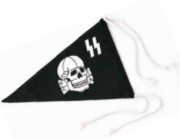
【HA SUPPORT FLAG】 ヘルズエンジェルズをサポートするペナント。USAからのインポート物/3990円 (FREE RIDE ☎0277-47-1055 www.free-ride.jp)