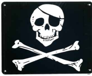
【アメリカンブリキ看板 (海賊マーク)】 あの海賊印がブリキ看板になって登場。アメリカ製。サイズ(約)：H18×W25.5センチ/1800円 (Candy Tower ☎06-6698-6969 www.candytower.com)